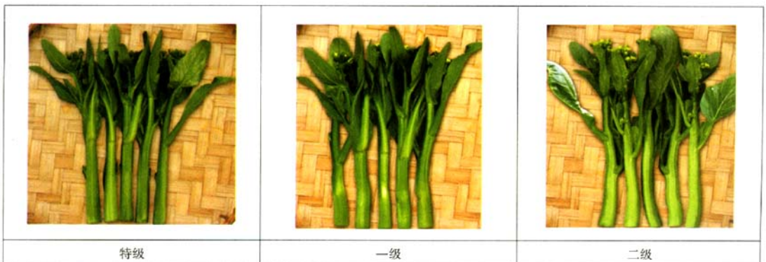
图1 菜心等级实物彩色图片

菜心等级实物彩色图片见图1,菜心规格实物彩色图片见图2,菜心包装实物彩色图片见图3。