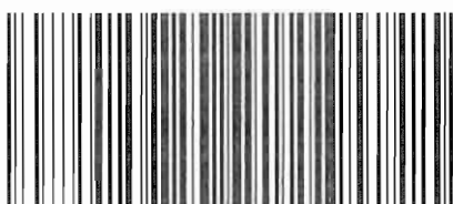
图 E.1 邻苯二甲酸酯类化合物标准物质的气相色谱-质谱选择离子色谱图

注：16种邻苯二甲酸酯类的出峰顺序依次为：邻苯二甲酸二甲酯(DMP)、邻苯二甲酸二乙酯(DEP)、邻苯二甲酸二异丁酯(DIBP)、邻苯二甲酸二丁酯(DBP)、邻苯二甲酸二(2-甲氧基)乙酯(DMEP)、邻苯二甲酸二(4-甲基-2-戊基)酯(BMPP)、邻苯二甲酸二(2-乙氧基)乙酯(DEEP)、邻苯二甲酸二戊酯(DPP)、邻苯二甲酸二己酯(DHXP)、邻苯二甲酸丁基苄基酯(BBP)、邻苯二甲酸二(2-丁氧基)乙酯(DBEP)、邻苯二甲酸二环己酯(DCHP)、邻苯二甲酸二(2-乙基)己酯(DEHP)、邻苯二甲酸二苯酯、邻苯二甲酸二正辛酯(DNOP)、邻苯二甲酸二壬酯(DNP)。